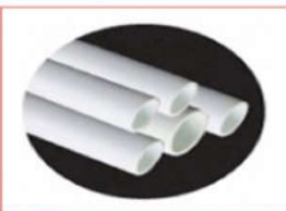
Ống PVC âm sàn : Vega