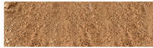
Cát vàng xây tô - Cát đổ bê tông ( cát Tân Ba ). (toàn bộ công trình đều sử dụng cát này, trừ hạng mục san lấp)