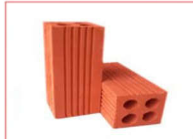
Gạch Tuynel nhả máy (8x8x18 cm)