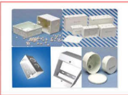
Hộp nối, đế âm Sino