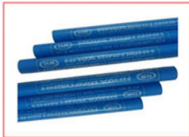
Ống nước lạnh Bình Minh di âm