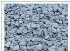
Đá 10x20 ( Đá Biên hòa )