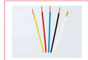
Dây điện Cadivi