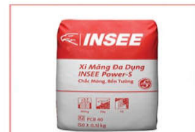
Xi măng INSEE