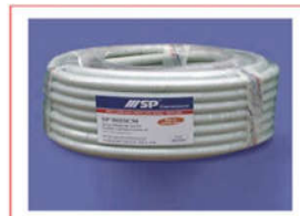
Ống ruột gà âm trong dầm - tường