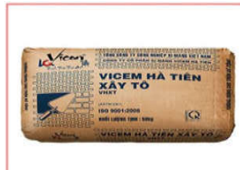
Xi măng Hà Tiên