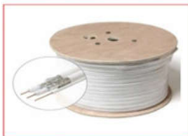
Dây truyền hình cáp, ADSL, ĐT